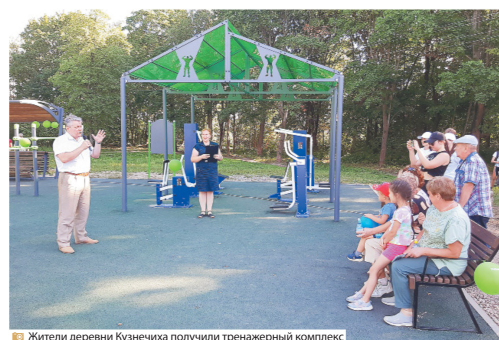
Жители деревни Кузнециха получили тренажерный комплекс

гут пользоваться жители всех возрастов, включая группу здоровья для активных кузнецких пенсионеров.