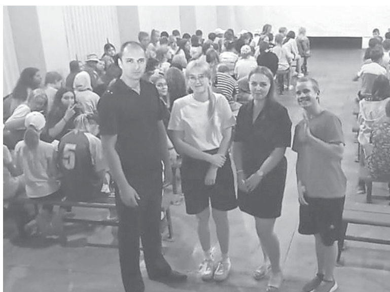
Во встрече участвовали около 150 ребят от 7 до 17 лет.

В завершение встречи дети получили памятки, буклеты и листовки.