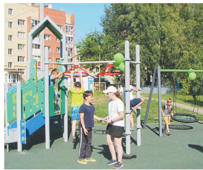
Отличный подарок детям в рамках проекта «Наши дворы»