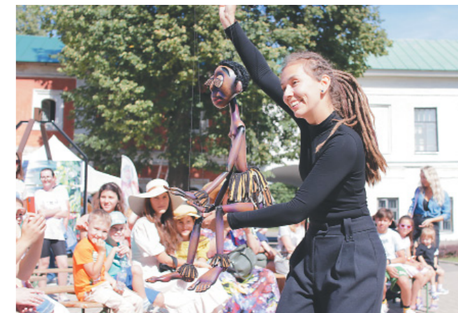
Выступление театра «Волшебная шляпа»

Мастер-классы колокольного звона – еще одна традиция фестиваля. Попробовать свои силы на небольшой звоннице мо-