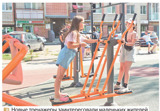
Новые тренажеры заинтересовали маленьких жителей

В рамках проекта «Наши дворы» в поселке Ивняки на улице Централь-