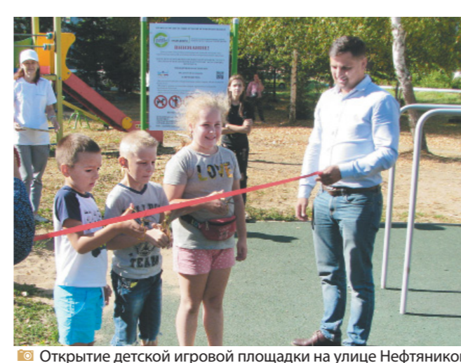
Открытие детской игровой площадки на улице Нефтяников в деревне Кузнециха