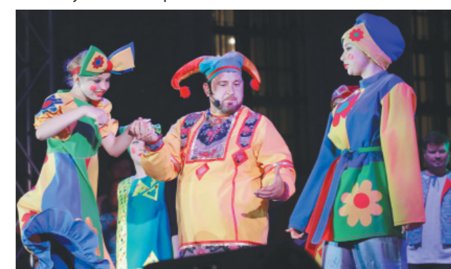
Опера-действо «Посвящение Петру Великому»