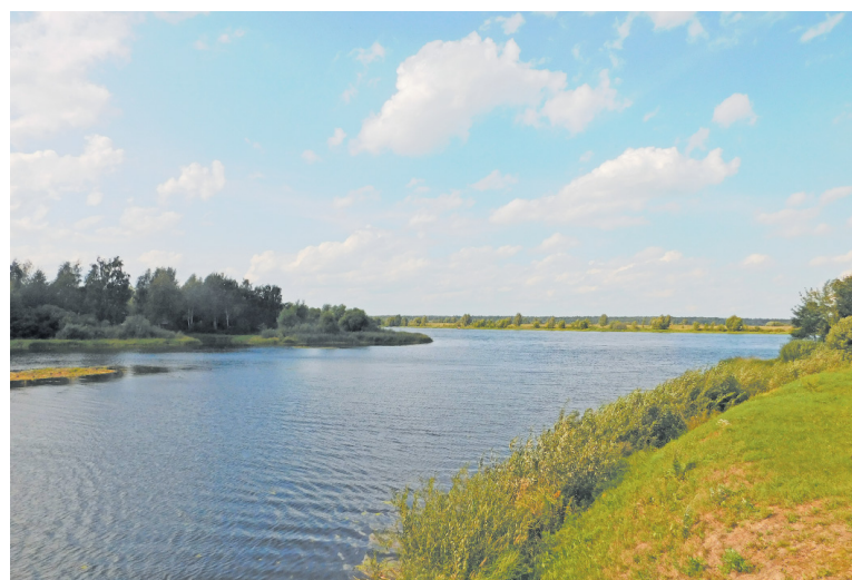
Устье Туношонки стало чистым

В 2022 году сотрудники филиала Федерального государ-