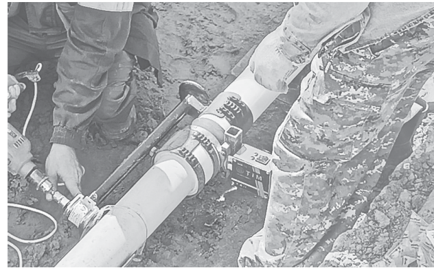
Ремонтные работы на сетях

что нам пришлось бы приобретать новый котел для котельной деревни Иванищеве), по электропотреблению – 1,3 миллиона рублей (за счет установки энергоэффективного оборудования).