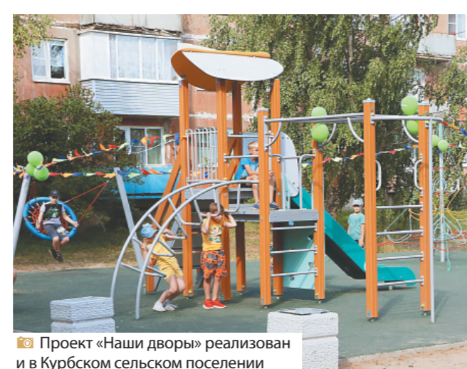
Проект «Наши дворы» реализован и в Курбском сельском поселении

Жители уверяют, что готовы поливать саженцы деревьев и новый газон (хотя этим будут занимать-