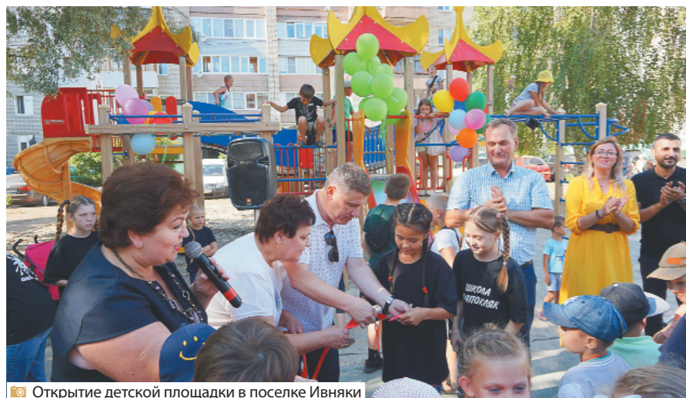
Открытие детской площадки в поселке Ивняки